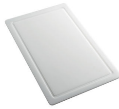
Tabla de corte de HDPE