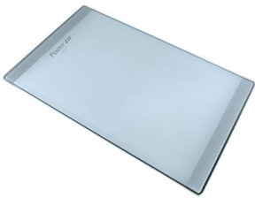
Tabla de corte de cristal