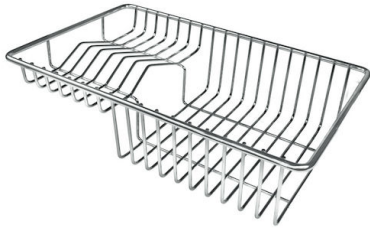
Cesta portaplatos inox