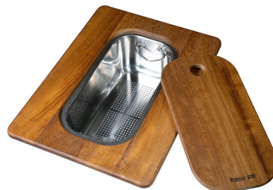
Tabla de corte Twin de madera Iroko con escurridor de pasta en acero inoxidable