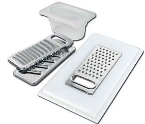
Kit rallador con soporte para anillo y bandeja de recogida de alimentos